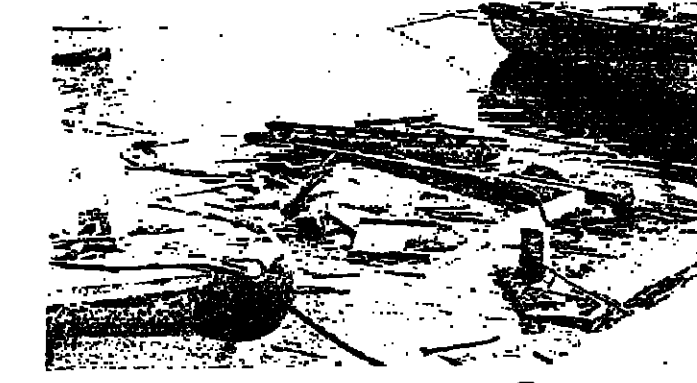
زورق مسوف (ميناء صيدا)